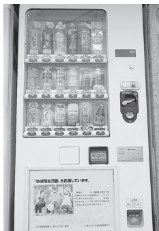
酒みせちきゅう屋に 設置されている 赤い羽根自動販売機